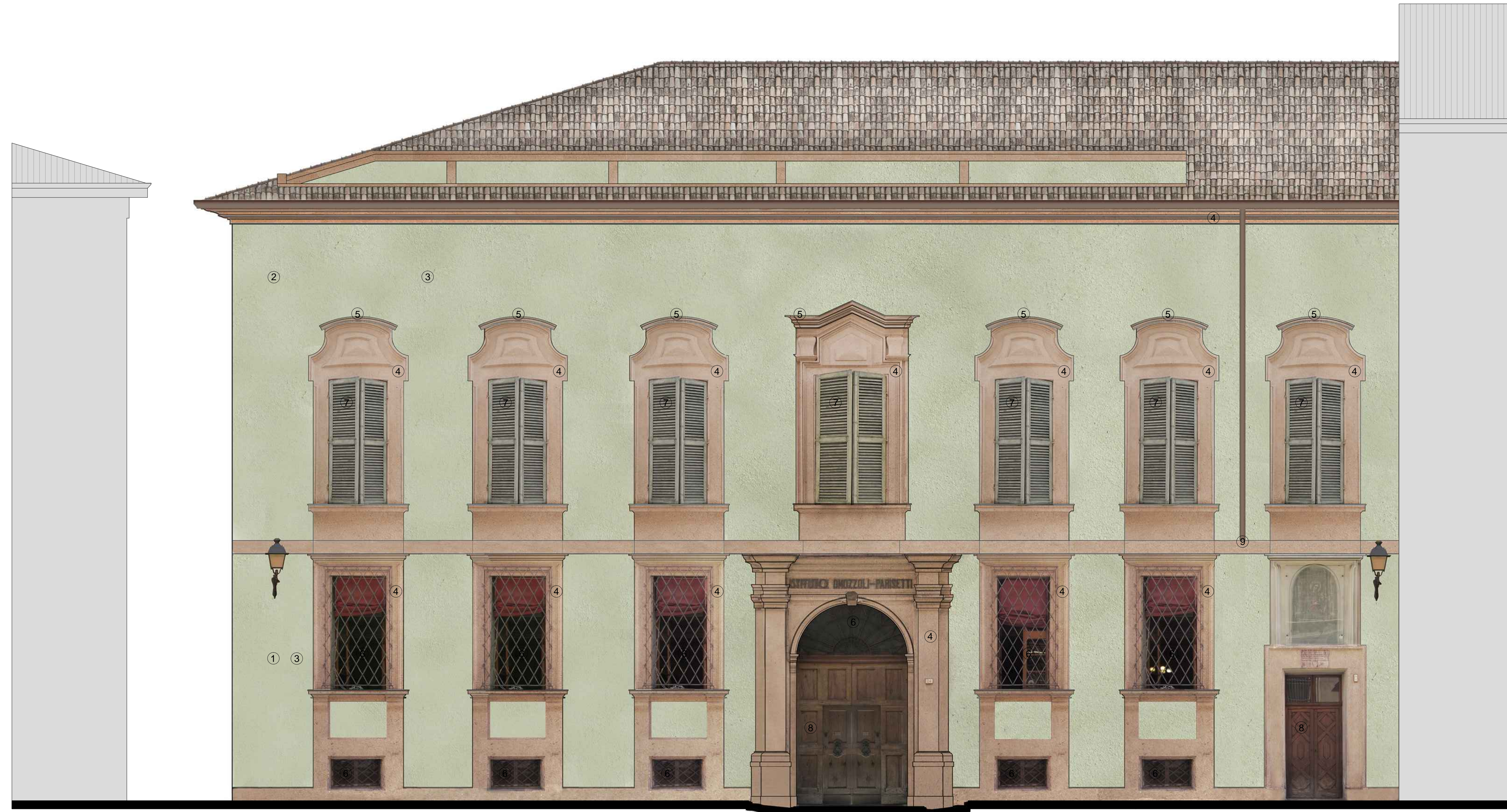
Prospetto sud-ovest - via Toschi