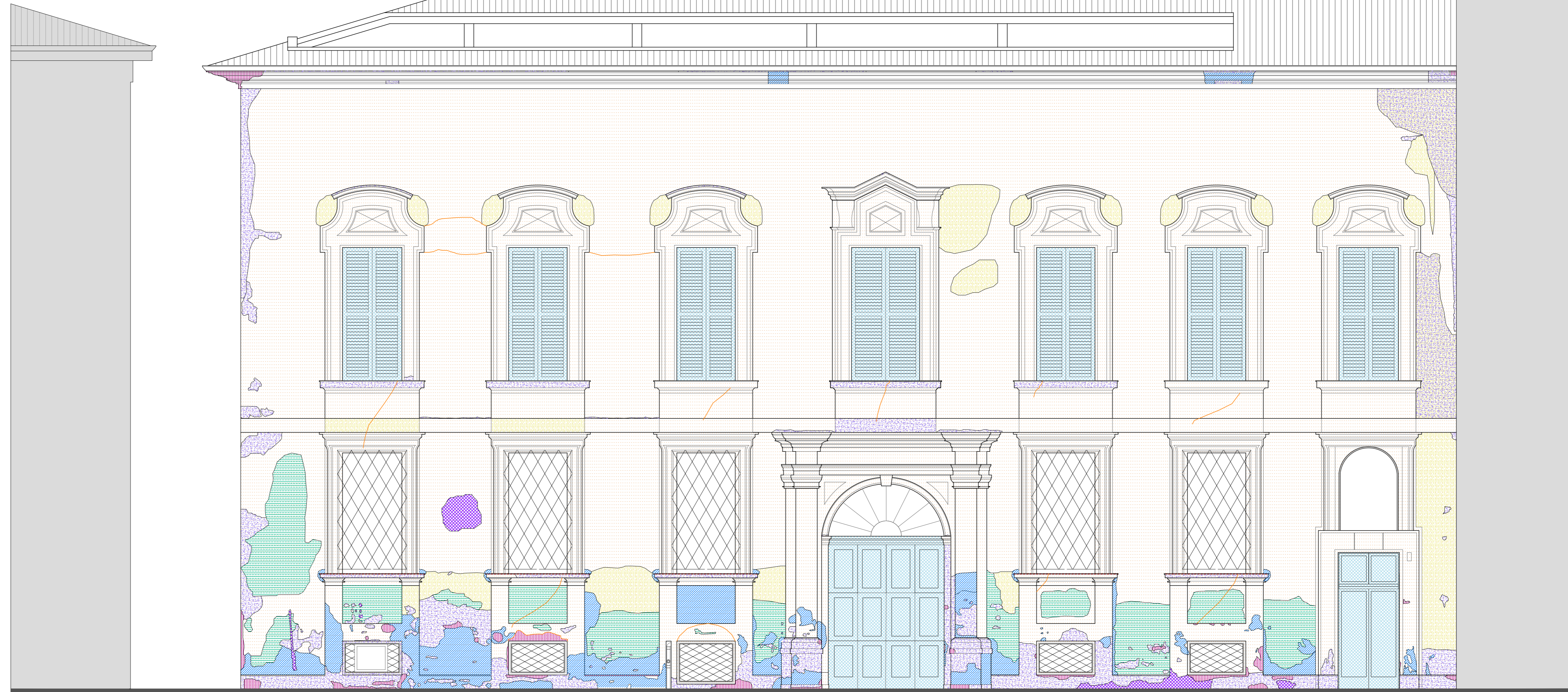
Prospetto sud-ovest - via Toschi