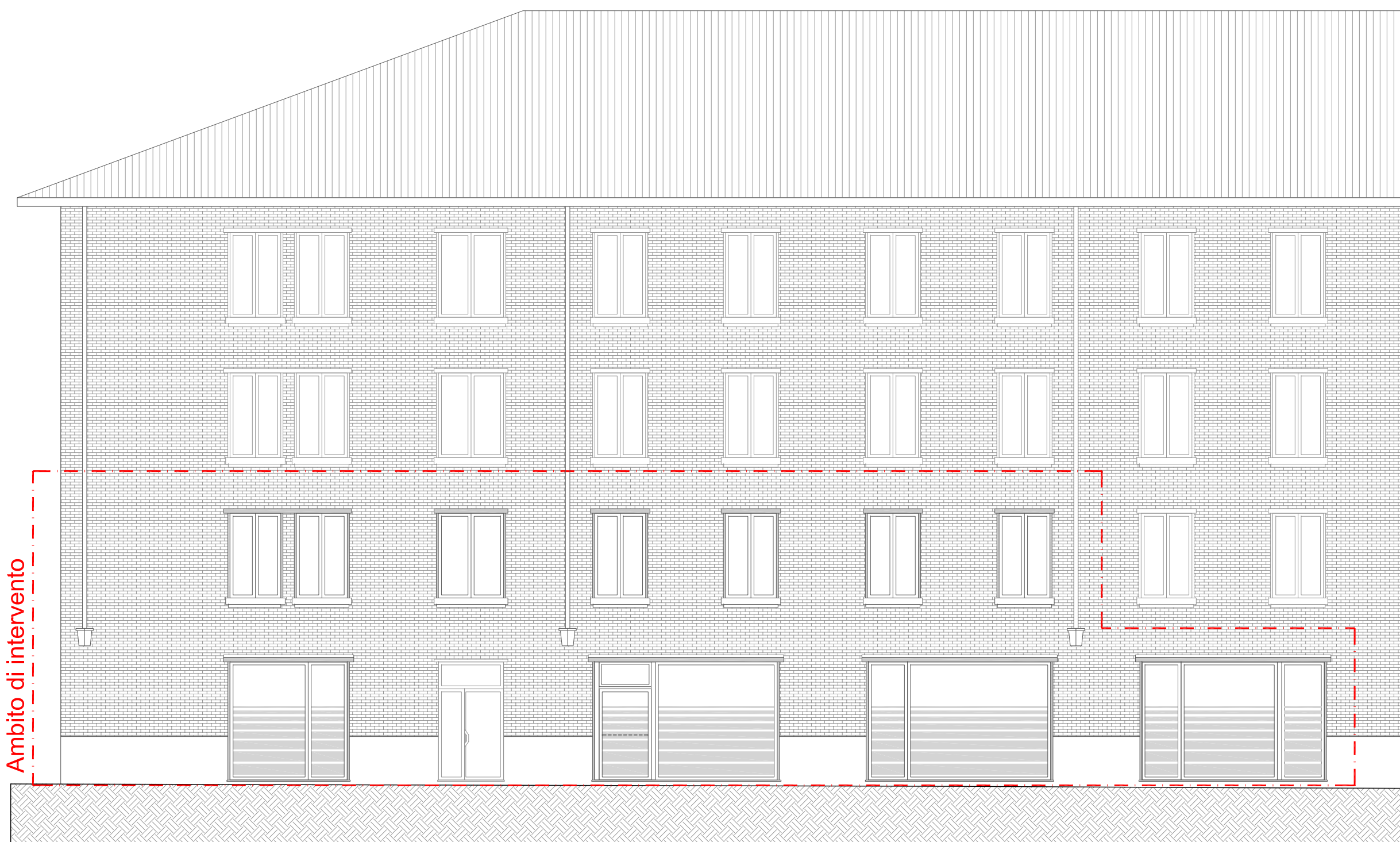
PROSPETTO NORD-EST - VIA SAN PIETRO MARTIRE

Tutte le misure sono da verificare in opera prima dell'esecuzione dei lavori.