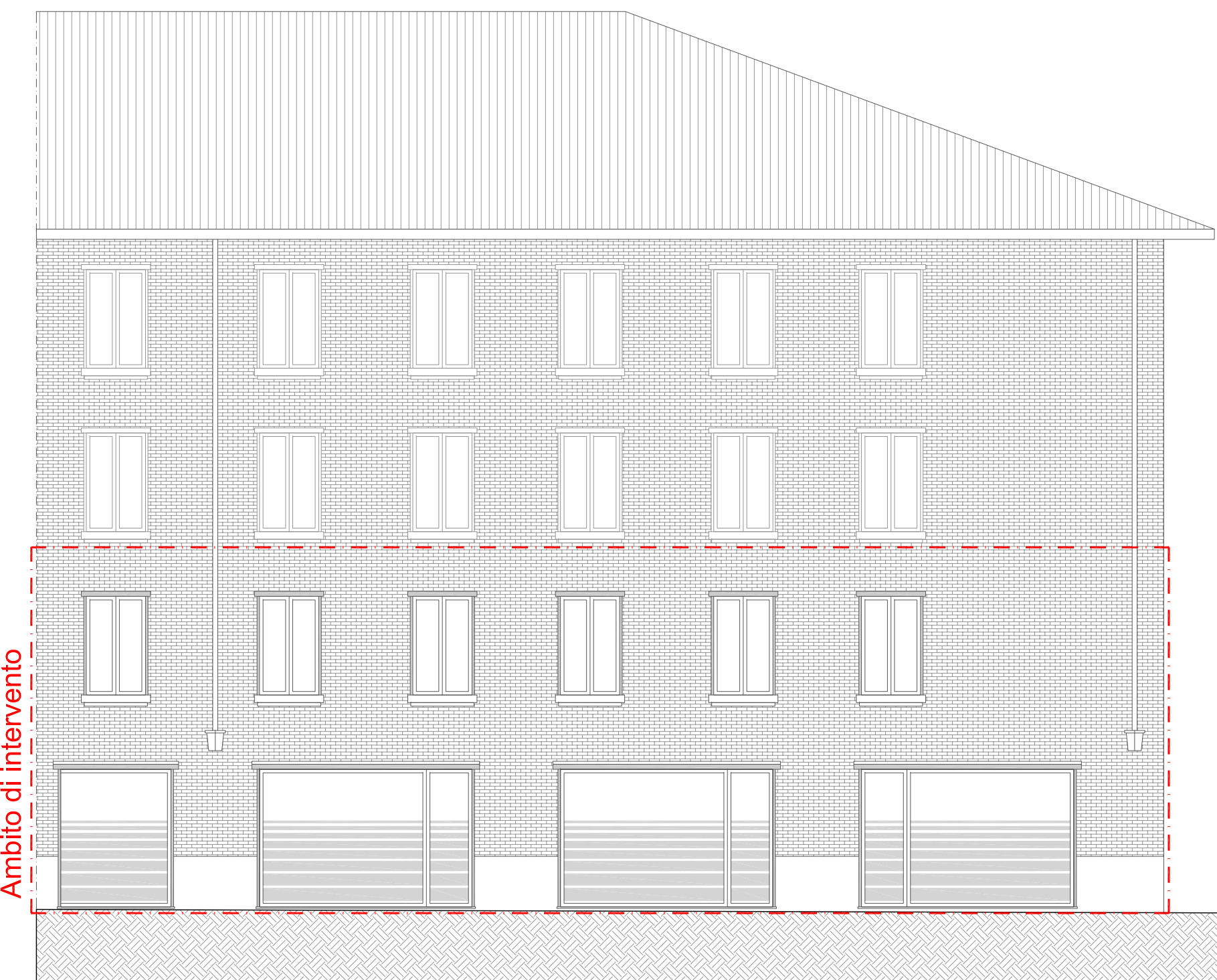
PROSPETTO SUD-EST - VIA GUIDO DA CASTELLO