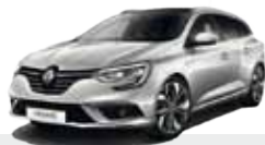
RENAULT MEGANE SPORTER dCi 8V 110 CV Energy Zen